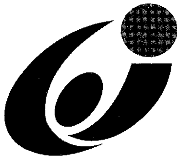
いしかわ教育の日シンボルマーク

(問い合わせ先) 石川県教育委員会事務局 庶務課 学校経営グループ 石川県育英資金担当 〒920-8575 金沢市鞍月1丁目1番地 TEL (076) 225-1816 (直通) FAX (076) 225-1814 E-mail: ikuei@pref.ishikawa.lg.jp